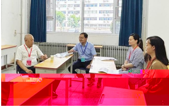
( 1 ) 作