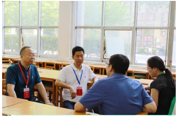
( 2 ) 作